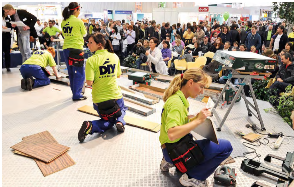
Die Bewerberinnen bei der Wahl zur „Miss Do-it-yourself 2010“ in Nürnberg. Mit dabei: Korkboden.

● Möchten Sie POS-Material bestellen oder benötigen Sie Nachschub? Einfach auf www.schoener-leben-mit-kork.de im Händlerbereich einloggen und anfordern.