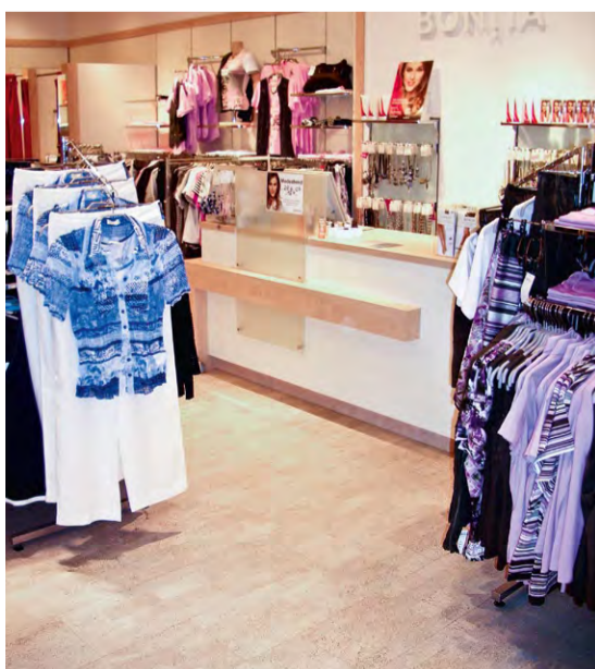
Kork goes Fashion: Ein BONITA-Store mit Korkboden

Unkompliziert zeigt sich der neue Store-Boden auch in der Pflege: Der versiegelte Belag ist leicht zu reinigen und braucht weder abgeschliffen noch nachversiegelt zu werden. Dank guter Dämmwerte zahlt sich der