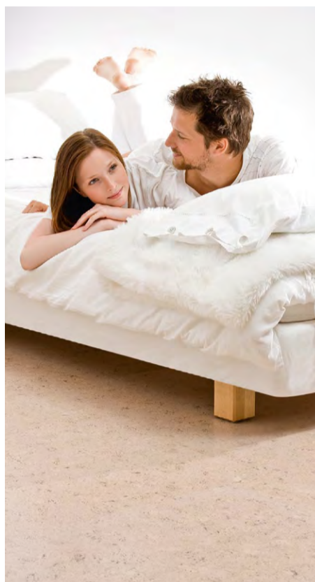
Wohlfühlklima garantiert: Auch 2011 stehen natürliche Materialien und Bodenbeläge wie Kork ganz hoch im Kurs

Rückenwind erhält die Korkbranche von Architekten, Designern und Raumausstattern. Diese haben Bodenbeläge als wichtige